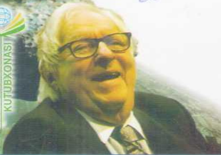
Рэймонд Дуглас Брэдбери (1920 — 2012)

XX асрнинг энг буюк фантаст-ёзувчиларидан бири.