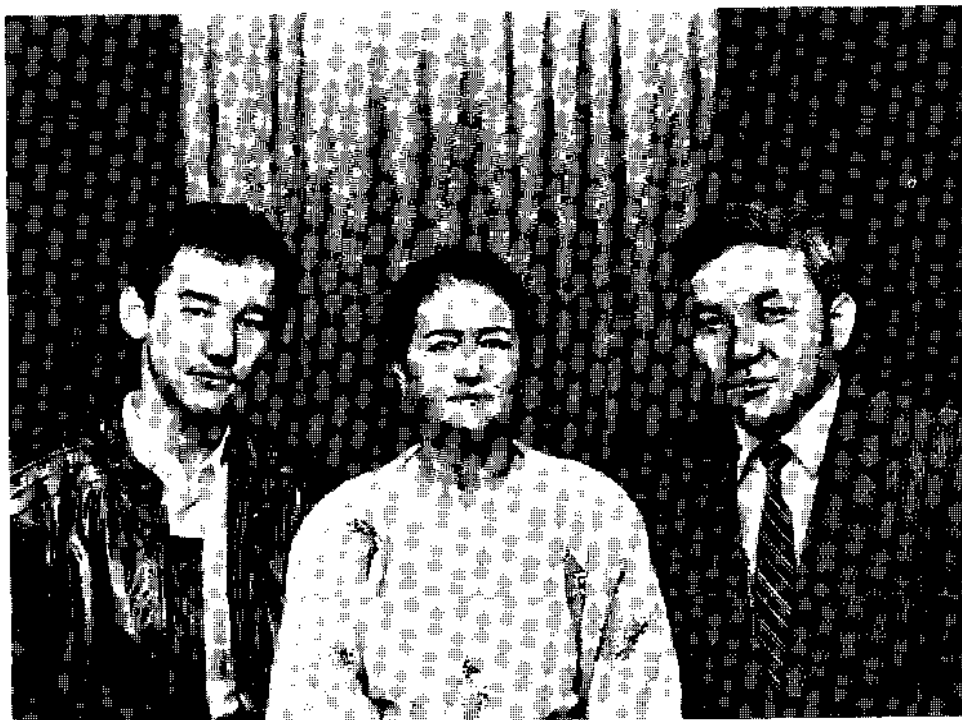
Ота-она ва катта ўғил Наврӯз. 1987 йил.