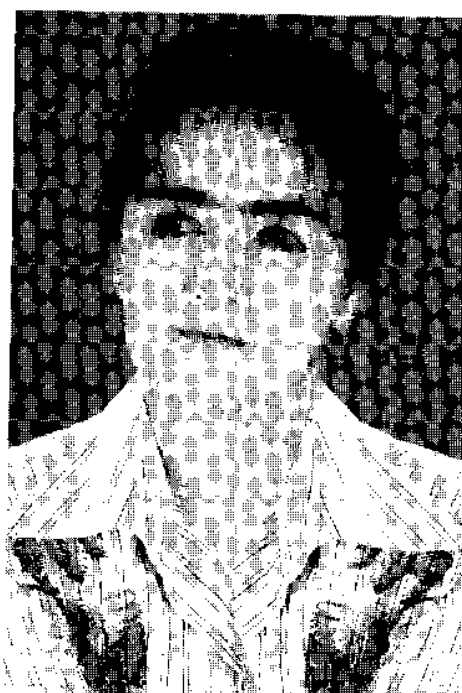
Қалам тебратиш ундан-да завқли.