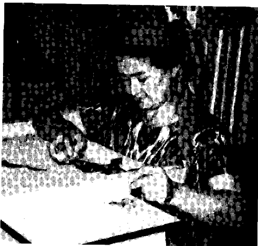
Зардўзи тумор тикиш катта завқ бағишлайди. 1995 йил.